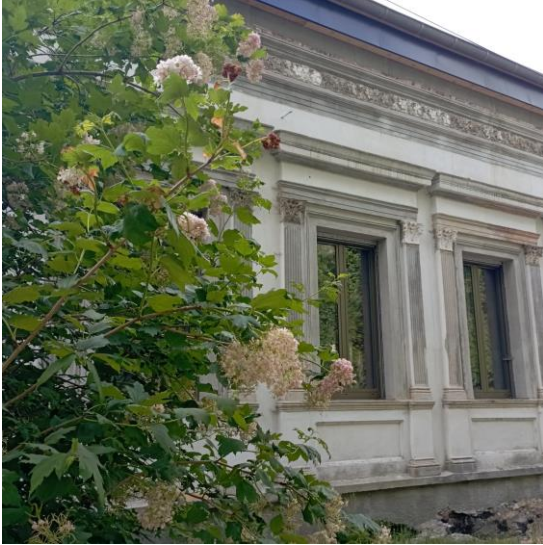
Villa Hornemann am Gipsweg