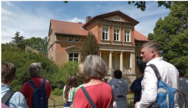
Villa Arndt an der Zossener Straße