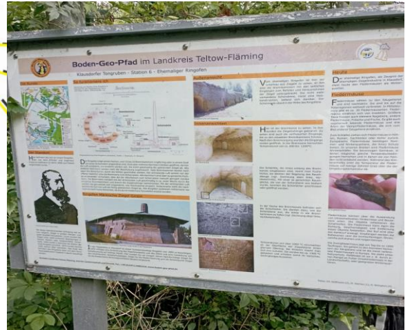
Unser Weg verlief teilweise am Boden-Geo-Pfad entlang