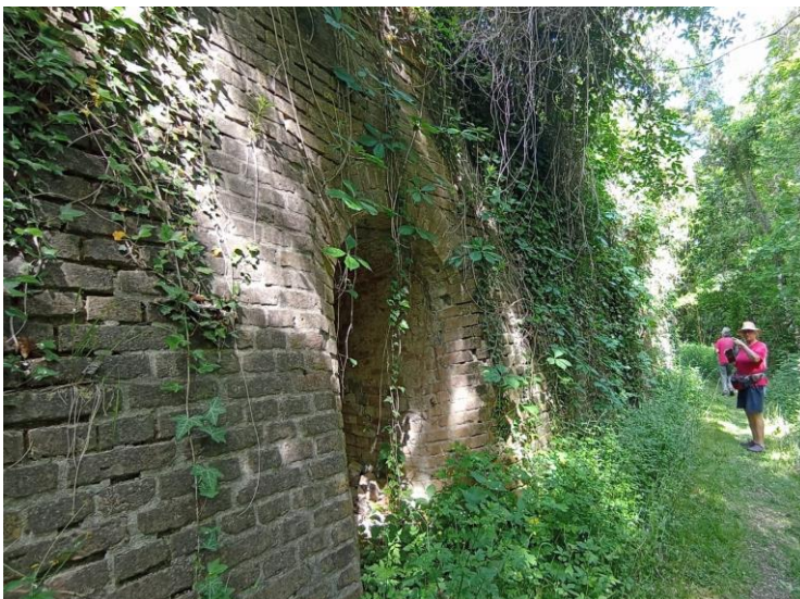
Diesen alten Ringofen kann man auch noch von innen betrachten