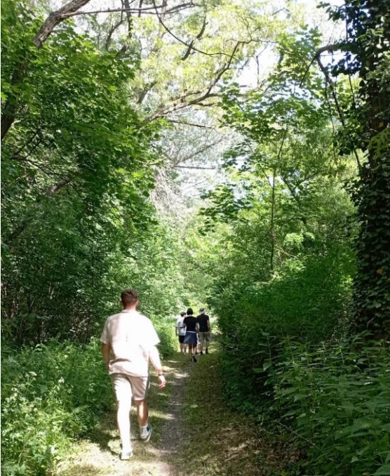
Hinein in den grünen Dschungel!