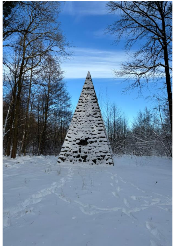
Pyramide als Denkmal für die im 1. Weltkrieg gefallenen Eisenbahnpioniere